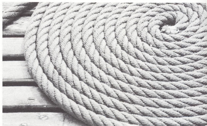
Selv ved stor udsnitsforstørrelse tegner Konica MR-640 skarpt. Derfor er det ikke noget problem at få sine billeder forstørret uden at skarpheden forringes.

med en tele på 80 mm. En konklusion må dog være, at der er tale om et virkelig godt målsøgerkamera med kun få fejl. Som en ekstra finesse fås